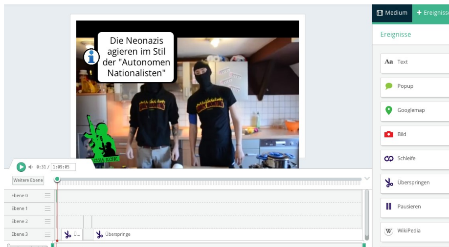
Beispiel: Bearbeitung von Videoclips

Kollaborative Methoden befördern demokratische Kompetenzen, ohne vordergründig mit dem Thema Diskriminierung zu argumentieren. Medienkompetentes Handeln wird so auch ein Garant für die Wahrnehmung elementarer gesellschaftlicher Interessen.